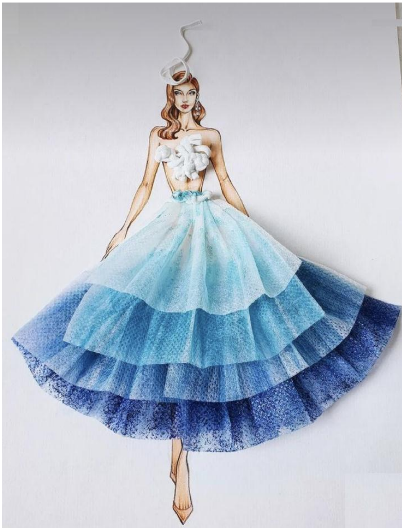
Рисунок 5 – Возможный вариант комплекта одежды.