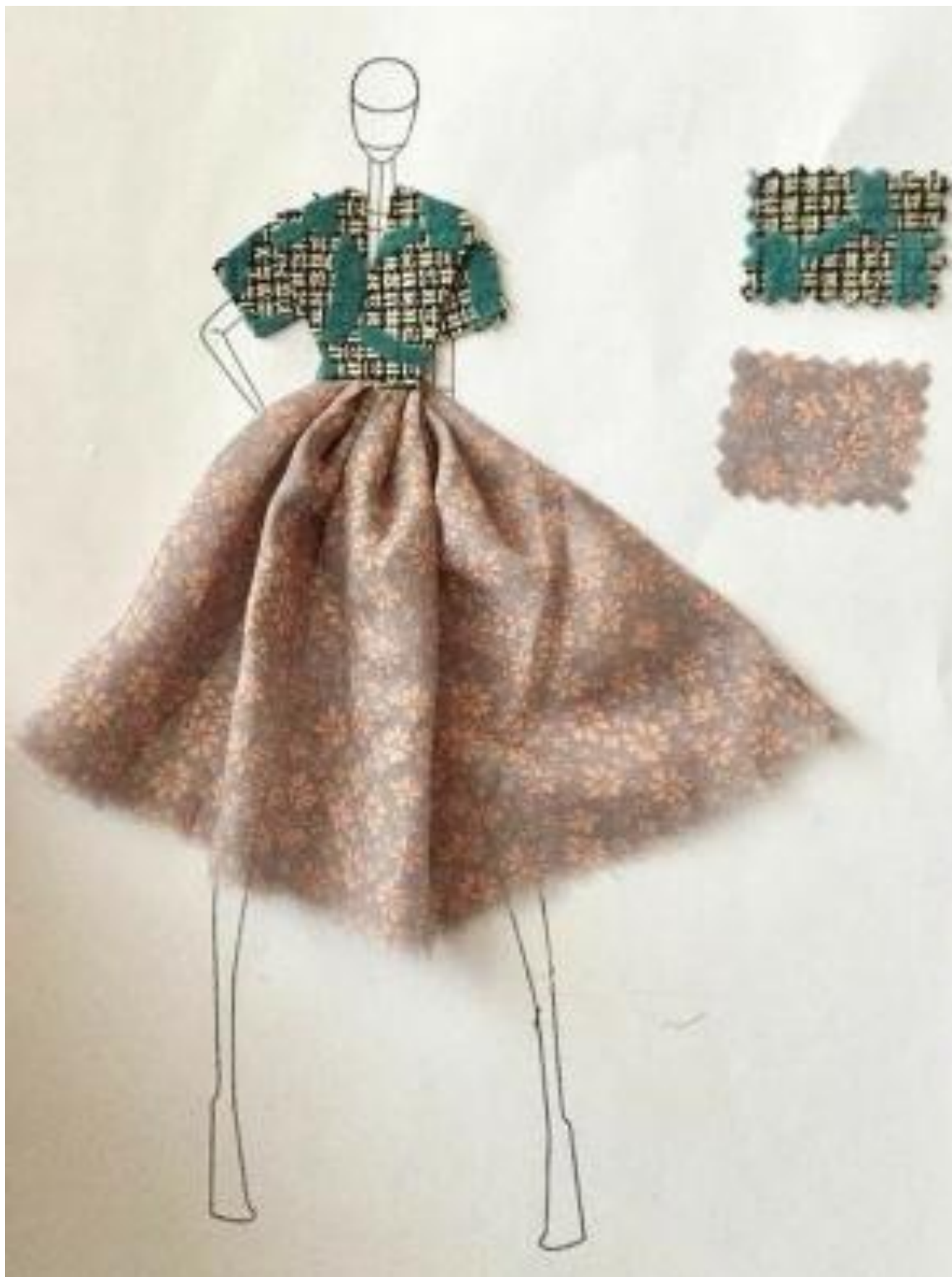
Рисунок 2 – Возможный вариант комплекта одежды.