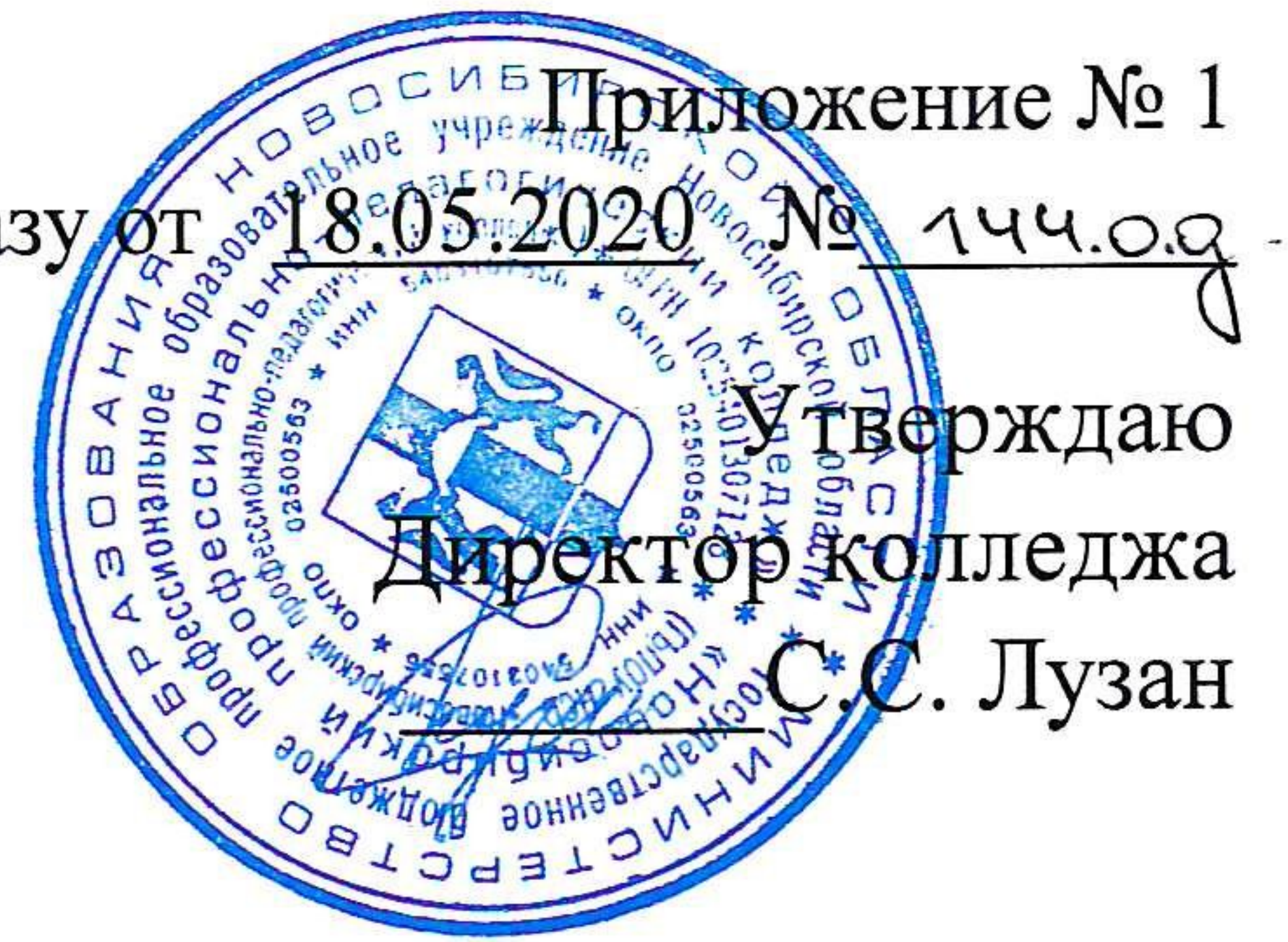
График защиты выпускной квалификационной работы группы 461 специальности 21.02.06 Информационные системы обеспечения градостроительной деятельности в 2019-2020 учебном году период с 15.06.2020 по 27.06.2020