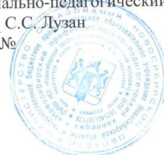
График работы спортивных секций ГБПОУ НСО «Новосибирский профессионально-педагогический колледж» на 2 семестр 2025 – 2026 учебный год