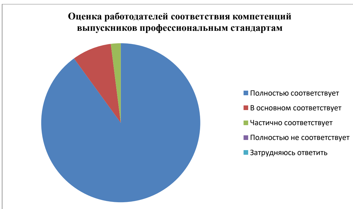
Рис. 2. Оценка работодателей соответствия компетенций выпускников профессиональным стандартам

Вопросы: «7. Насколько Вы удовлетворены уровнем теоретической подготовки выпускников?»; «8. Насколько Вы удовлетворены уровнем практической подготовки выпускников?»; «9. Насколько Вы удовлетворены коммуникативными качествами выпускников?»; «10. Насколько Вы удовлетворены способностями выпускников к командной работе и их лидерскими качествами?»; «11. Насколько Вы удовлетворены способностями выпускников к системному и критическому мышлению?»; «12. Насколько Вы удовлетворены способностью выпускников к самоорганизации и саморазвитию?»