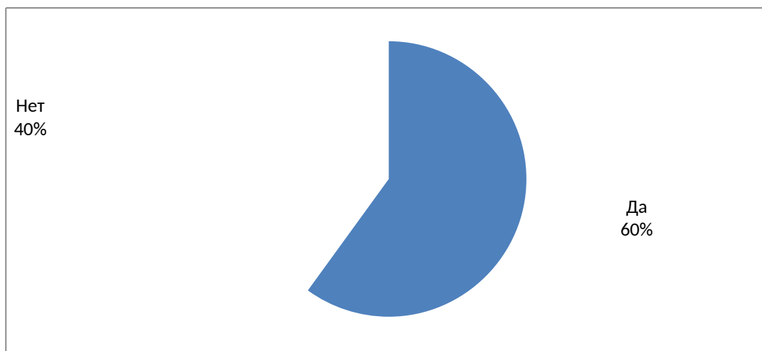
Рис. 1. Наличие у организации опыта трудоустройства выпускников, освоивших образовательную программу в рамках целевого обучения

Опыт трудоустройства выпускников, освоивших образовательную программу в рамках целевого обучения, имеется у 60% работодателей (рис. 1).